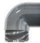
63 mm PVC-Winkel für Direktanschluß Strömerplatte an 63 mm Klebeschlauch